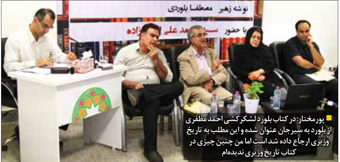
عکس: امین ارجمند | پاسارگاد