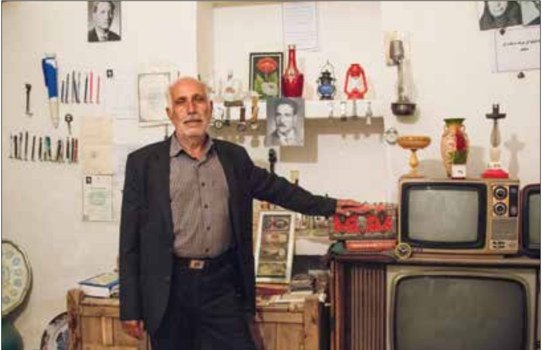
منزل محمدابراهیم رفتنی