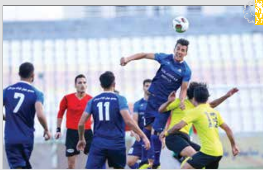
تیم فوتبال گل گهر سیرجان که در چارچوب جام چهار جانبه «گرامیداشت یاد و خاطره ۱۵ هزار شهید استان فارس» به مصاف پارس جنوبی جمع رفته بود در ضربات پنهانی با نتیجه ۶ بر ۵ مغلوب این تیم شد.

۴ در هر مربع ۳×۳ اعداد از ۱ تا ۹ نوشته شود و در نتیجه هیچ عددی نباید تکرار شود.