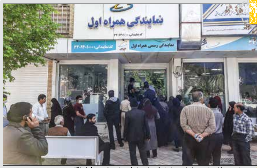
صف دریافت سیم کارت تلفن همراه برای نخب‌تولم یک میلیون

۱. در هر سطر و ستون باید اعداد ۱ تا ۹ نوشته شود. بدیهی است که هیچ عددی نباید تکرار شود. ۲. در هر مربع ۳x۳ اعداد از ۱ تا ۹ نوشته شود و در نتیجه هیچ عددی نباید تکرار شود.